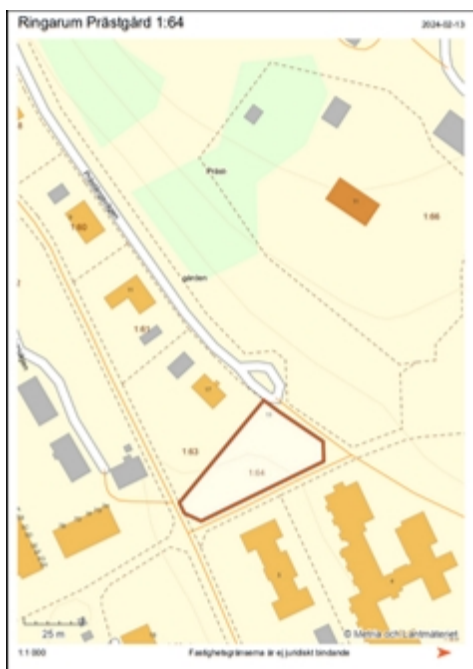
Figur 1. Röd begränsningslinje markerar Ringarums Prästgård 1:64.