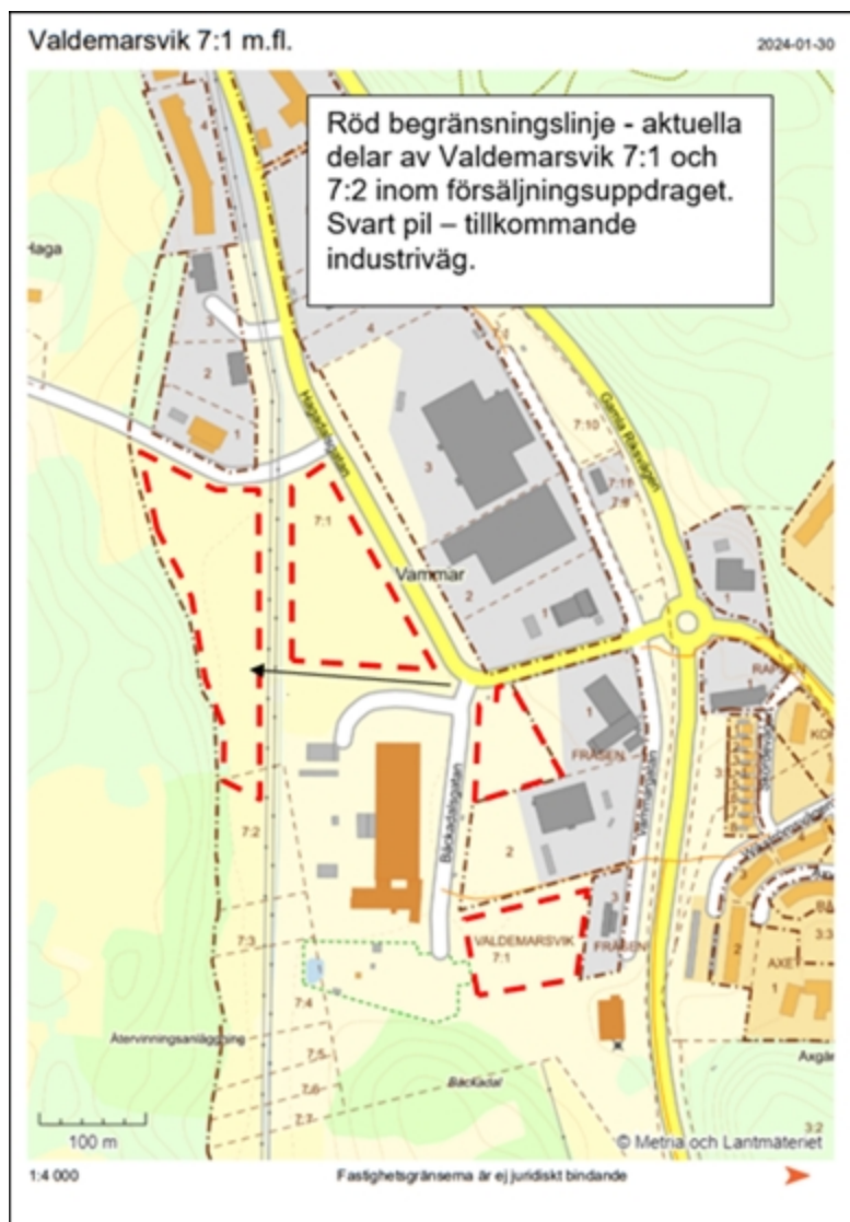
Figur 1. Delar av Valdemarsvik 7:1 (och 7:2) i Vammar industriområde som föreslås ingå i försäljningsuppdrag.

förberedande åtgärder kan behöva göras så som utbyggnad av industrigata, ledningsflytt med mera vilket får beredas vid respektive försäljning.