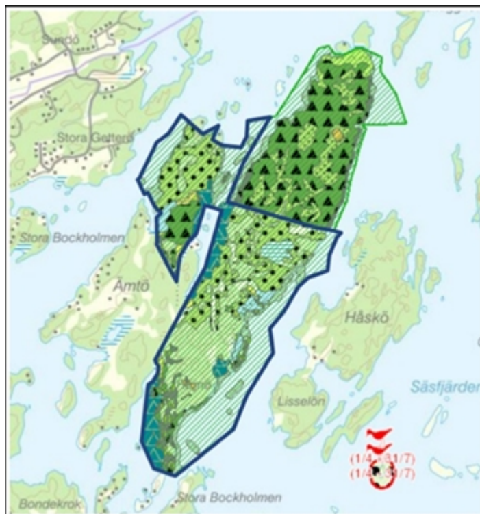
Figur 2. Ämtö 4:19 med naturtypkarta och skötselområde.