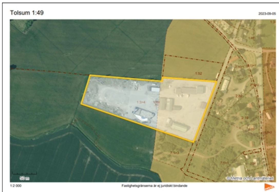
Figur 1. Flygfoto Tolsum 1:49 (gul begränsningslinje). Orange färg markerar gällande detaljplaneområden.