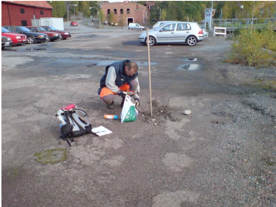
Uttag vid SGI:s sonderingspunkt S39. Tunn asfalt. Luktar svagt stenkolstjära. Ger utslag på sprayen.