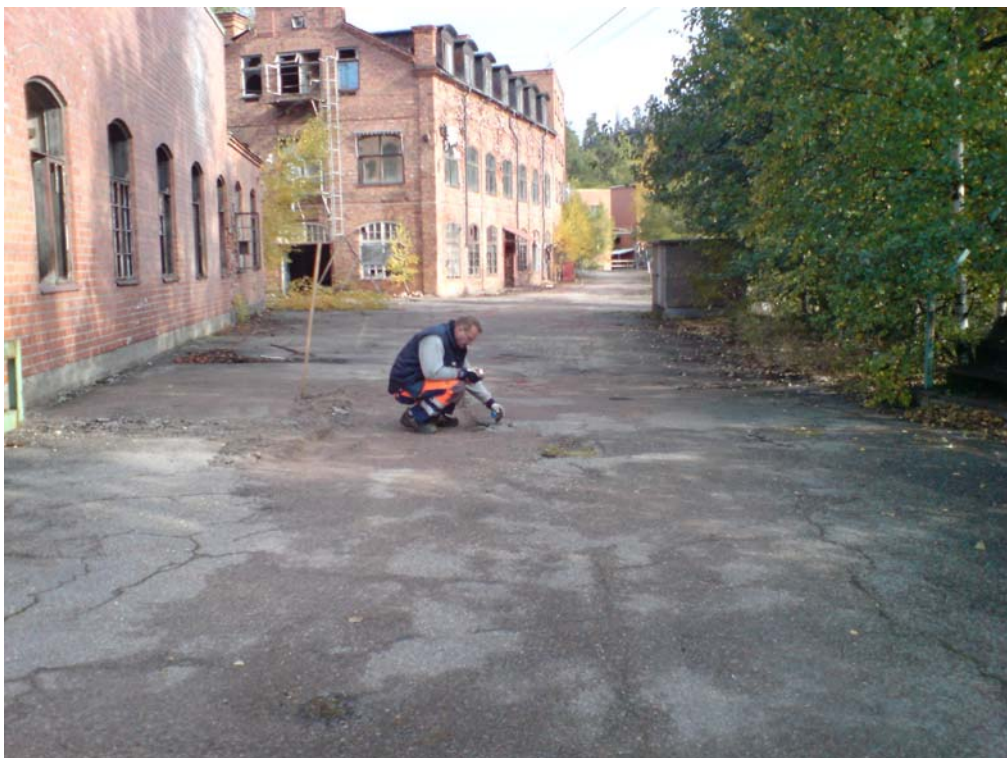
Prov S6: Uttag av prov i sydöstra delen av SGI:s provgröp S6. Luktar stenkolstjära men inte så mycket. Ger utslag på sprayen.