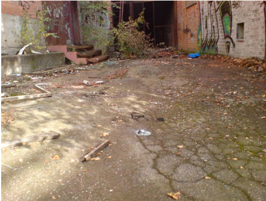
S8b: Uttag av prov i språnget mellan husen H och K. Bedöms som gammal asfalt (motsvarande S8). Luktas ganska mycket stenkols tjära och ger utslag på sprayen.