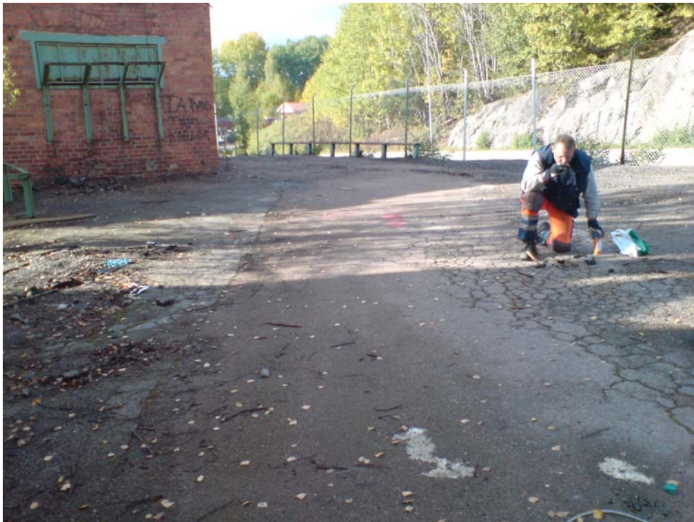
S9a och b: Notera skillnaden i asfalt (b från ytan där Anders sitter, a några meter norr om byggnad B).