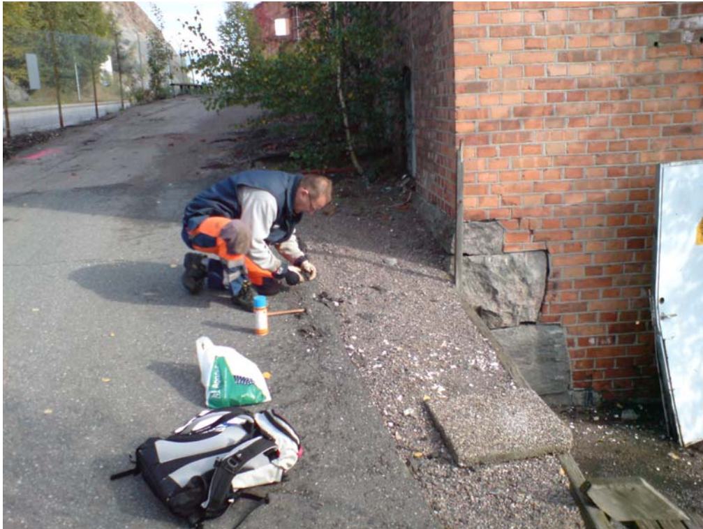
Prov S10c: Vid sydvästra gaveln av hus B. Asfalten ser något nyare ut (jfr kanten i bild) och luktar mindre än i 10 a o b. Luktar mera olja, ”som asfalt ska”. Ger dock utslag på sprayen.