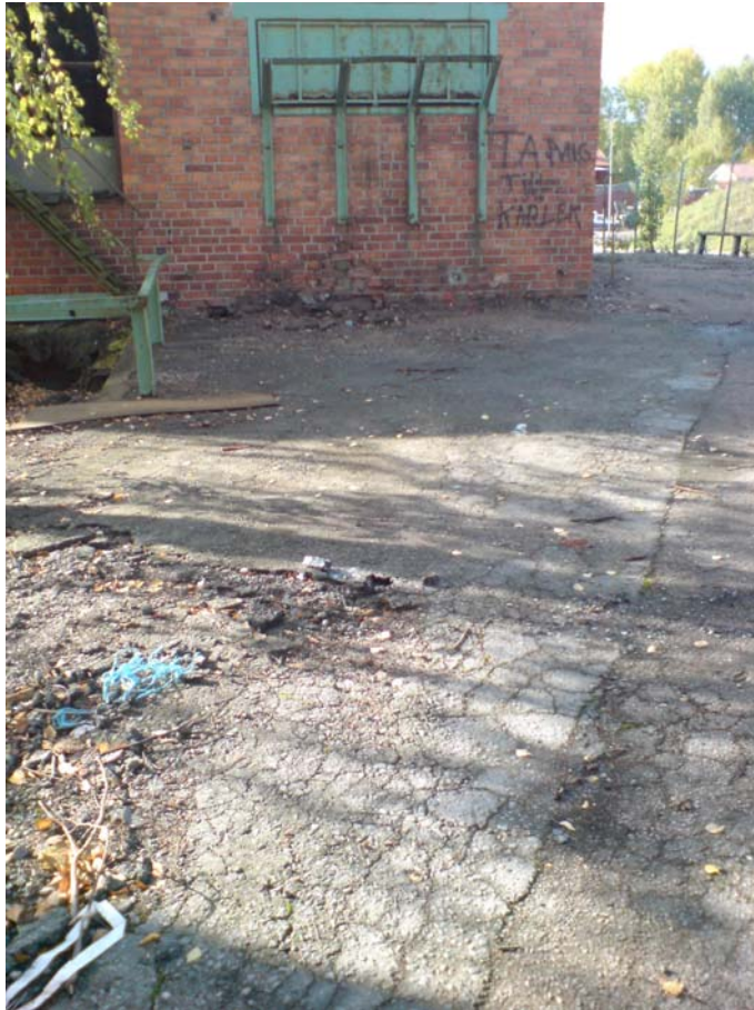
S9a: Uttag av prov S9 a, norr om hus B. Asfalten bedöms som något yngre än vid S9b. Luktar dock riktigt unket och stenkolstjära! Ger utslag på sprayen.