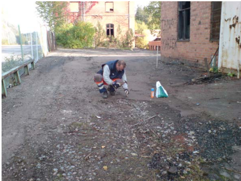
Prov S10 b i asfalt utanför byggnad B, i vad som bedöms som ngt yngre asfalt jämfört med vid S10a. Luktar också den unket och stenkolstjära, dock något mindre än i a. Ger utslag på sprayen.