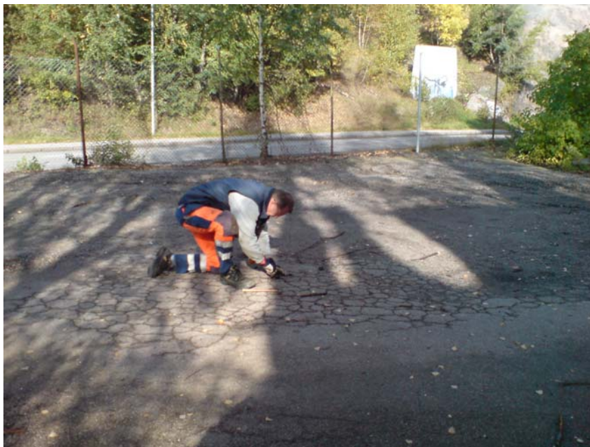
S9B: Uttag av prov S9 b, söder om hus F. bedöms som gammal asfalt. Luktar unket och stenkolstjära. Ger utslag på sprayen.