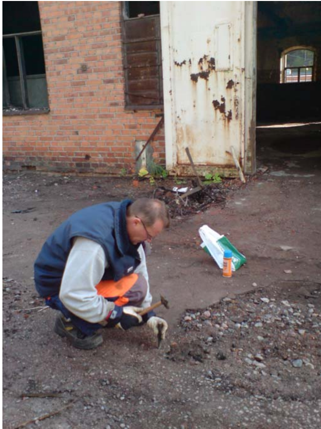
Prov S10 a i asfalt utanför byggnad B (i norra kanten av SGI:s provgrop S10). Asfalten bedöms som äldre. Luktar riktigt unket och stenkolstjära! Utslag på spray.