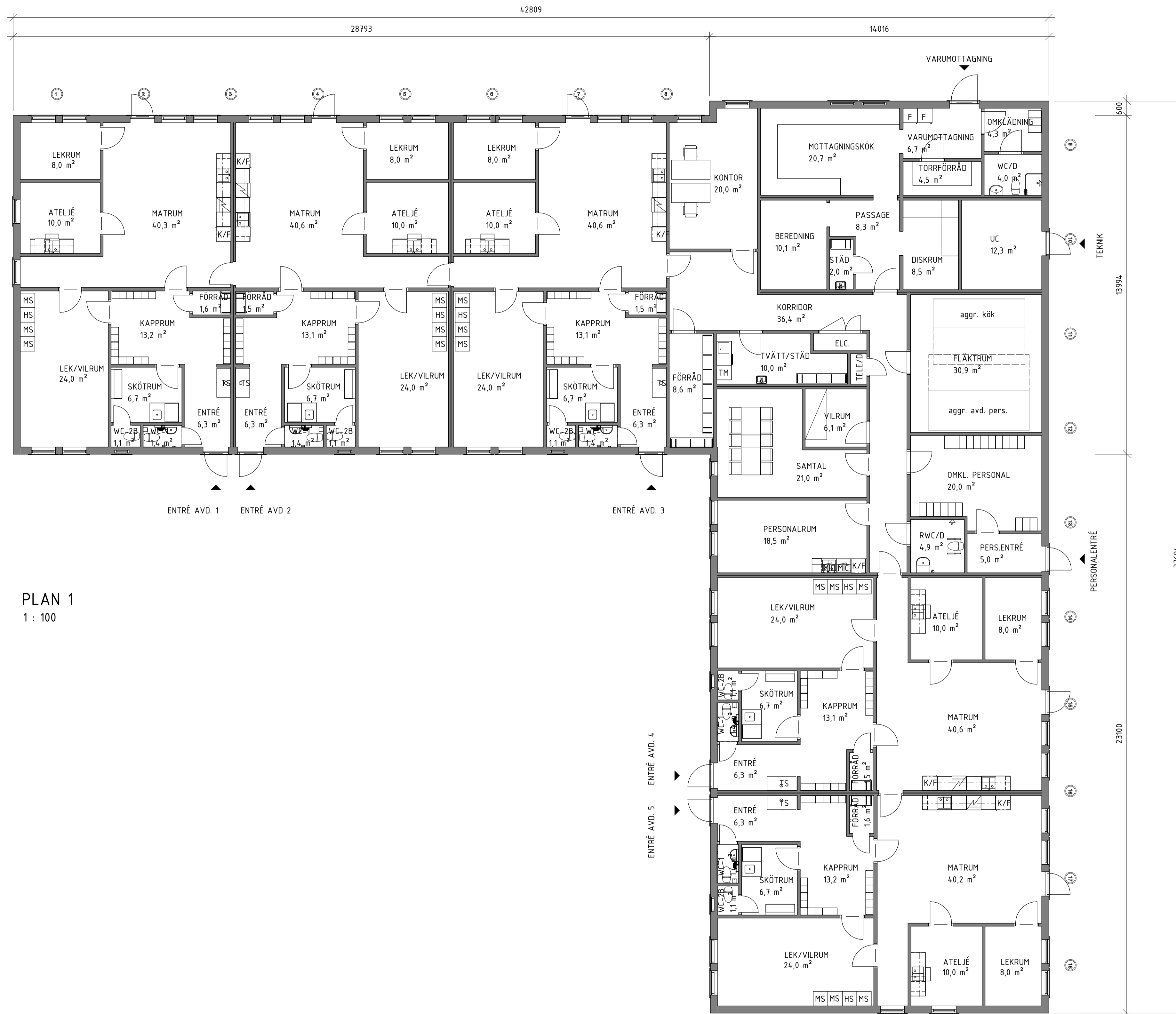
PLAN 1 1 : 100