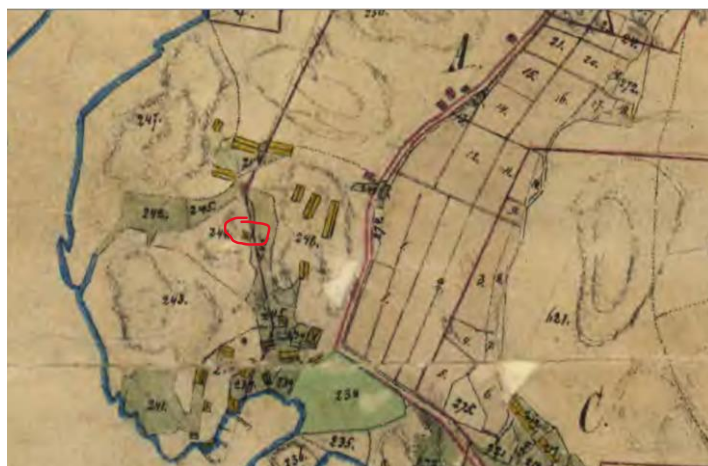
Markering av mindre byggnad där i dag syns en grund

en mindre byggnad där det idag finns en grund. Det kan inte utläsas om det är ett bostadshus eller uthus men av grunden att döma är det en enklare byggnad.