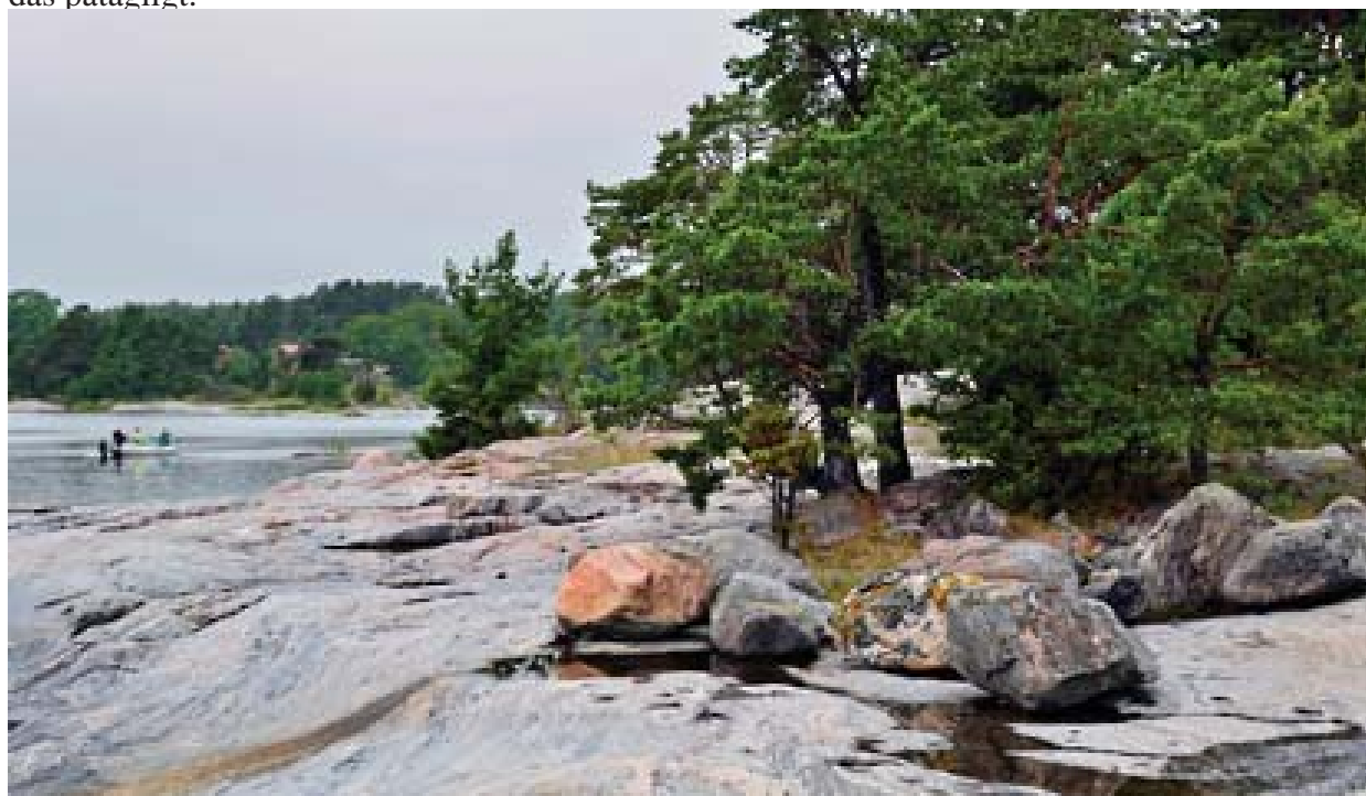
Figur 6:4. Eköns camping.

Genomförs ÖP:n med exploateringar inom de utpekade utvecklingsområdena bedöms detta vara positivt för friluftslivet och att denna vinst är större än det intrång i riksintresset för naturvården som det innebär. Det ger skärgården underlag att utvecklas och vidmakthålla befintliga badplatser, båtramper och vandringsleder mm. Samtidigt är kommunens ambition att skydda värdefulla naturområden som är av stort värde för riksintresset genom naturvårdsprogrammet. Ny bebyggelse ska därför främst tillkomma i anslutning till eller som en för tätning av redan bebyggda områden. Om en viss andel mark kan upplåtas för exploatering i skärgården kan bättre förutsättningar ges för att tillgodose riksintressena då ett större antal permanentboende och besökare kan bidra till en ökad näring som kan möjliggöra skötsel av värdefulla områden och skapa utökad service. Att hålla stränder och attraktiva områden allemansrättsligt tillgängliga är av stor vikt. Genom att även skapa förutsättningar för utveckling och förbättring av den biologiska mångfalden genom att bevara en stor andel gröna ytor med naturlig vegetation samt sköta om skyddade