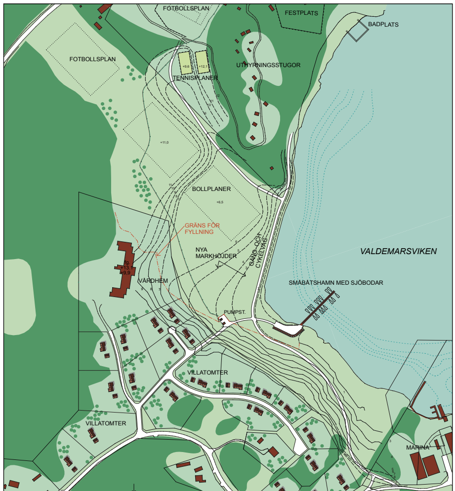
Detaljplanskiss för hur Grännäsviken kan komma att utvecklas efter att saneringen är klar. Skiss: Leif Leandertz arkitektkontor.