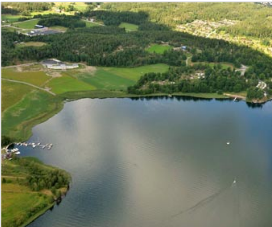
Platsen som föreslagits för nyttiggörande av muddermassorna i ansökan till Miljödomstolen är på land vid Grännäsviken.

På Miljödomstolens uppmaning lämnades i februari 2009 en kompletterande utredning av deponering i djuphåla in. Efter samråd, skriftliga synpunkter och kompletterande utredningar beslutade kommunen att inte gå vidare med djuphålsalternativet. Det förslag som prövas nu i domstolen omfattar nyttiggörande av muddermassor i en landfyllning vid Grännäsviken.